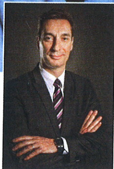
Claude Cadeau Cabinet MGP

de cette formule, il la rend lisible pour le client. En outre, le dispositif propose, en cas d'utilisation du fonds Betamax et des autres FCP recommandés, une estimation du potentiel d'évolution à la hausse comme à la baisse du portefeuille. Cela peut rassurer le particulier dans sa prise de décision et lui permettre de mieux appréhender le risque pris. « Par ailleurs, les estimations ne sont pas des simulations historiques de trois à cinq ans, jugées non représentatives du potentiel de long terme, mais sont calculées selon un algorithme », ajoute le CGPI. Trois formules sont alors disponibles. Dans le cadre du portefeuille « Duo », la répartition se fait entre le fonds en euros et Betamax. Toujours autour de ce socle, si l'épar-